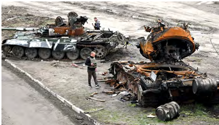
Xe tăng Nga bị bắn cháy tại ngoại ô Kyiv, tháng 4/ 2022.

lừa, dễ bị trị. Vì thế, tất cả xí nghiệp tại Ukraine bị quốc hữu hóa và tất cả sản phẩm nông nghiệp đều bị thu mua, với giá ăn cướp của dân. Chỉ với hai chính sách này thôi đã gây ra nạn đói 1921-1922, cướp đi hơn một triệu sinh mạng dân Ukraine.